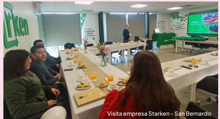
Visita empresa Starken - San Bernardo