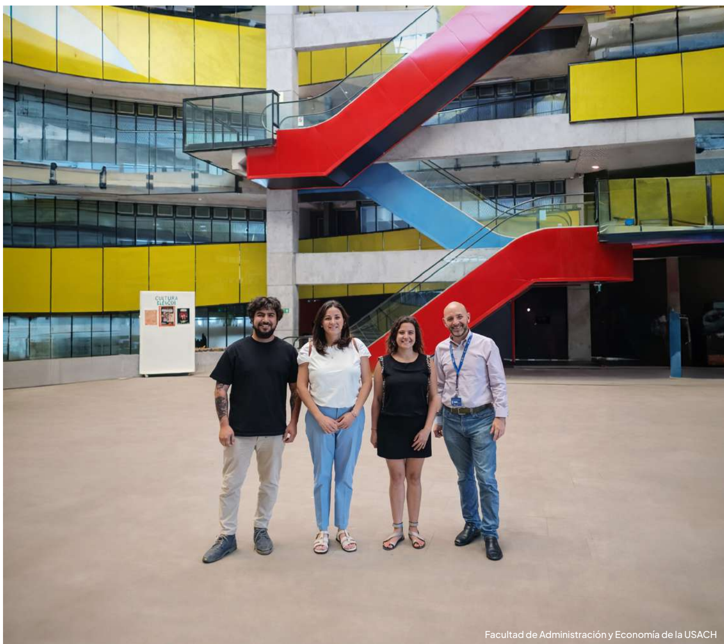
Facultad de Administración y Economía de la USACH

Además, se discutieron las posibles actividades a realizar en 2025, buscando ideas que respondan a las necesidades y expectativas de la comunidad MBA USACH. El aporte del comité consultivo fue clave al proponer ideas innovadoras para fomentar la participación de los egresados/as y enriquecer las propuestas para 2025.