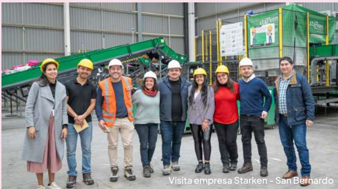
Visita empresa Starken - San Bernardo