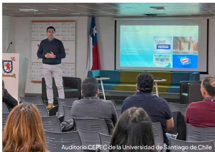
Auditorio CEPEC de la Universidad de Santiago de Chile