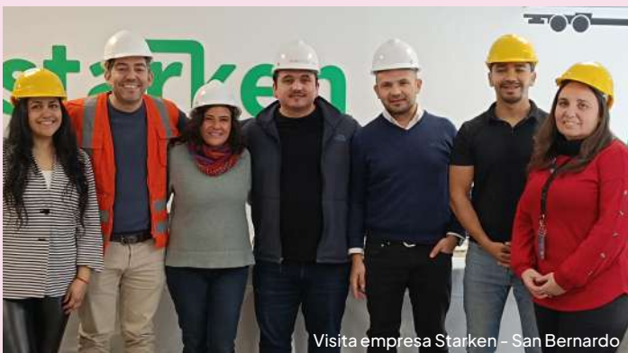
Visita empresa Starken - San Bernardo