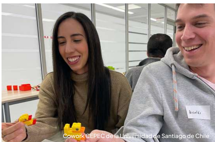
Cowork CEPEC de la Universidad de Santiago de Chile