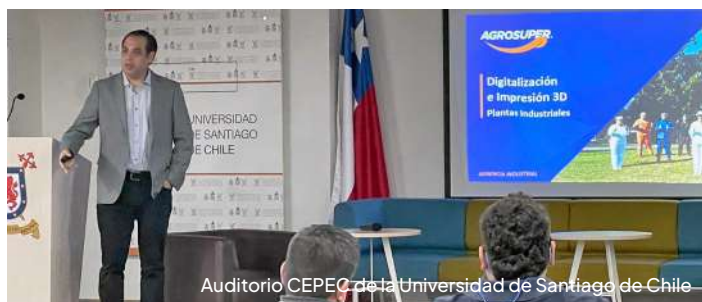
Auditorio CEPEC de la Universidad de Santiago de Chile