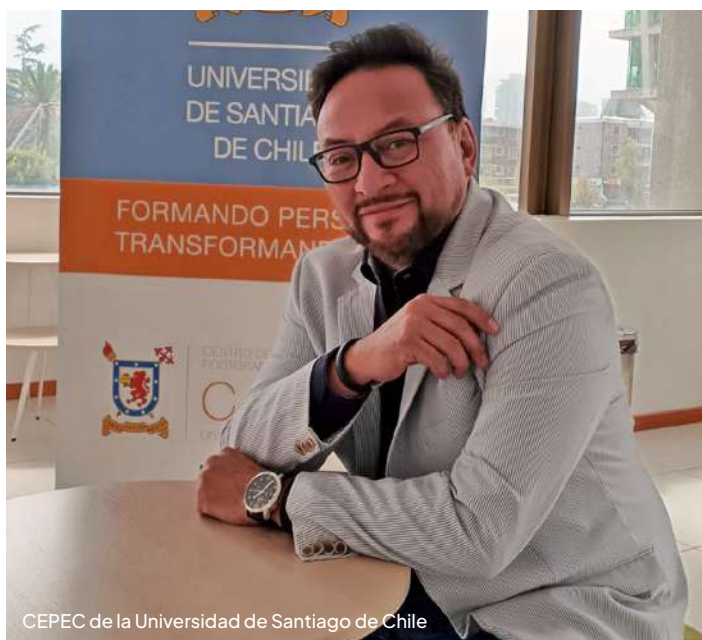
CEPEC de la Universidad de Santiago de Chile

Durante las dos reuniones, también se les explicó la malla del programa, indicándoles que durante el primer semestre tomarán los cursos obligatorios: Liderazgo y Coaching para Ejecutivos, Entendiendo las Organizaciones y sus Desafíos, Comunicación Efectiva, Administración Estratégica de Negocios, Pensamiento Creativo y Gestión. Se les recordó que para poder aprobar el MBA es necesario realizar 13 electivos, Proyecto de Graduación I, Proyecto de Graduación II y Trabajo de Graduación.