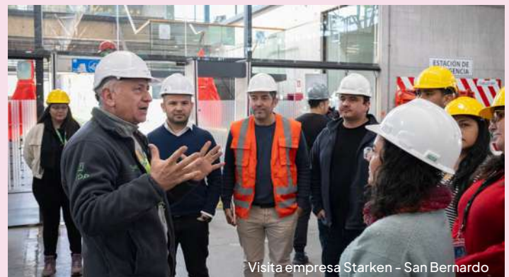
Visita empresa Starken - San Bernardo