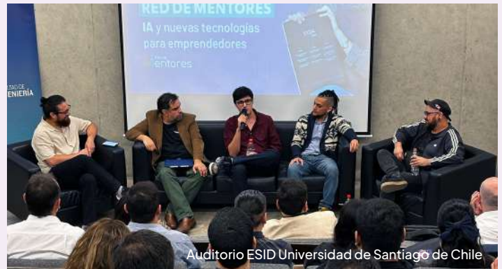
Auditorio ESID Universidad de Santiago de Chile