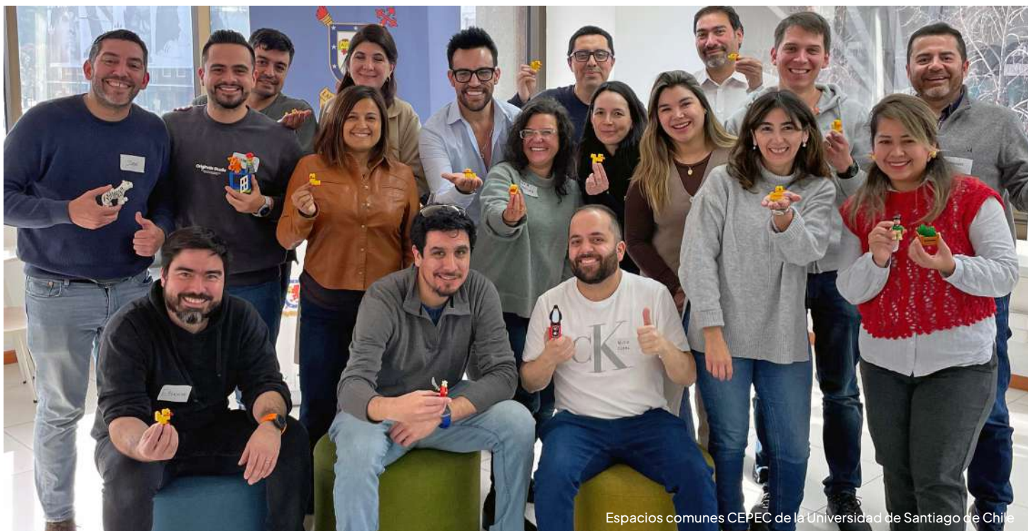
Espacios comunes CEPEC de la Universidad de Santiago de Chile