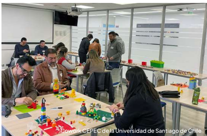
Cowork CEPEC de la Universidad de Santiago de Chile