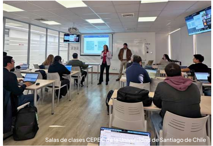
Salas de clases CEPEC de la Universidad de Santiago de Chile