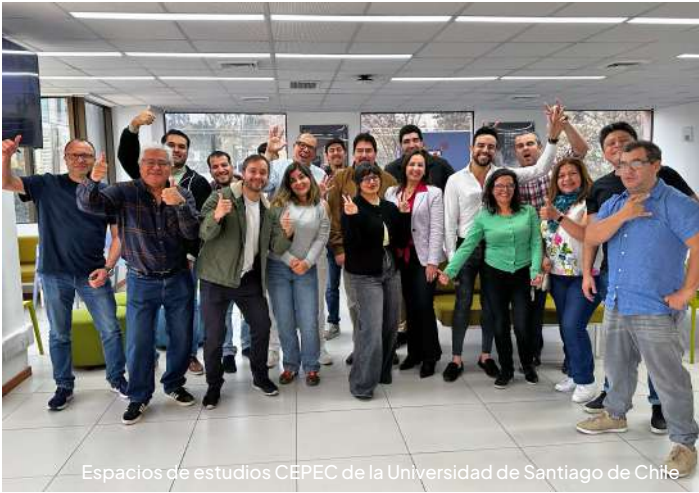
Espacios de estudios CEPEC de la Universidad de Santiago de Chile