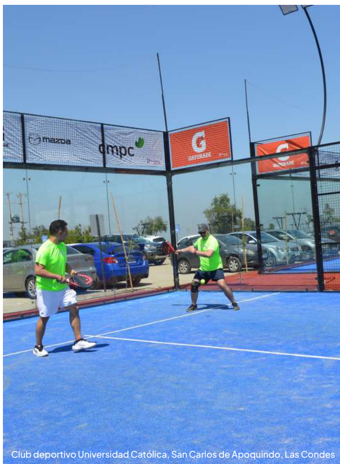
Club deportivo Universidad Católica, San Carlos de Apoquindo, Las Condes