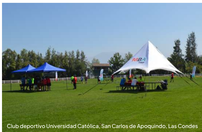
Club deportivo Universidad Católica, San Carlos de Apoquindo, Las Condes