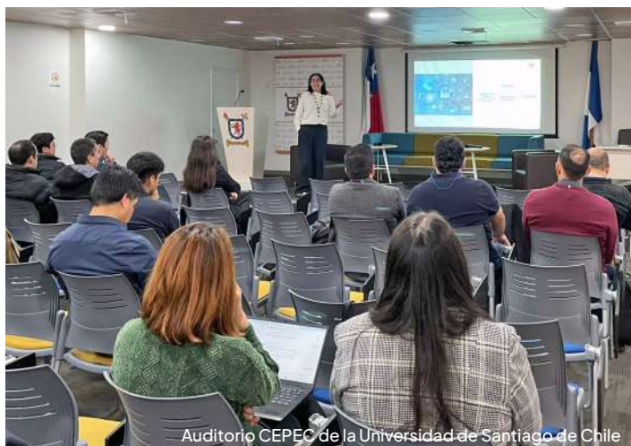
Auditorio CEPEC de la Universidad de Santiago de Chile

El seminario congregó a estudiantes, egresados, académicos y profesionales interesados en conocer aplicaciones concretas de la transformación digital en la industria alimentaria, ofreciendo una valiosa instancia de actualización y networking.