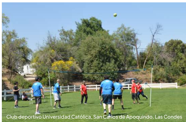
Club deportivo Universidad Católica, San Carlos de Apoquindo, Las Condes