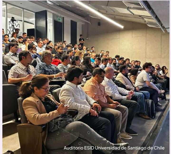
Auditorio ESID Universidad de Santiago de Chile

La jornada, que se extendió desde las 9:00 hasta las 18:00 horas, ofreció un espacio diseñado para inspirar, educar y conectar a los asistentes con herramientas tecnológicas clave para potenciar sus emprendimientos. A través de charlas prácticas, paneles de expertos y casos reales, se exploró el impacto de la inteligencia artificial (IA), blockchain y otras tecnologías emergentes en la transformación de modelos de negocio tradicionales y la apertura de nuevas oportunidades de innovación.