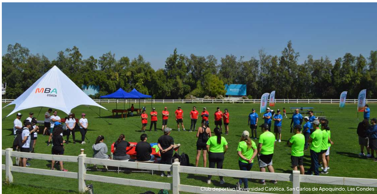
Club deportivo Universidad Católica, San Carlos de Apoquindo, Las Condes