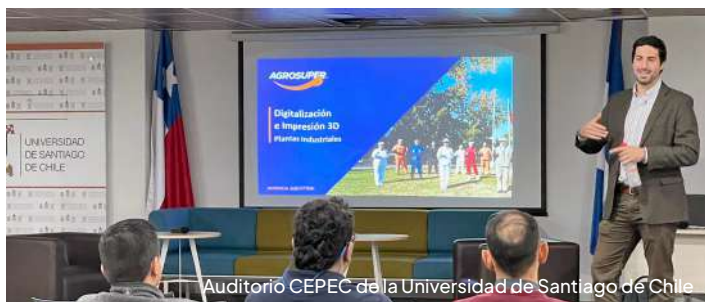
Auditorio CEPEC de la Universidad de Santiago de Chile