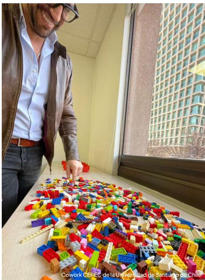
Cowork CEPEC de la Universidad de Santiago de Chile