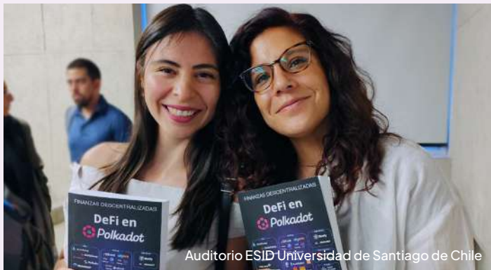
Auditorio ESID Universidad de Santiago de Chile